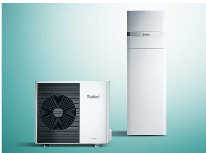
Tepelné čerpadlo aroTHERM Split vzduch-voda, hydraulický modul uniTOWER