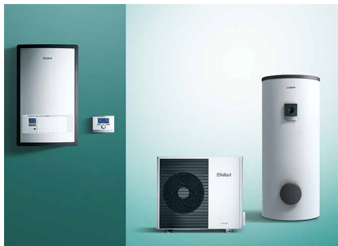
Závesný hydraulický modul, systémový regulátor multiMATIC VRC 700, tepelné čerpadlo aroTHERM Split vzduch-voda so zásobníkom teplej vody uniSTOR